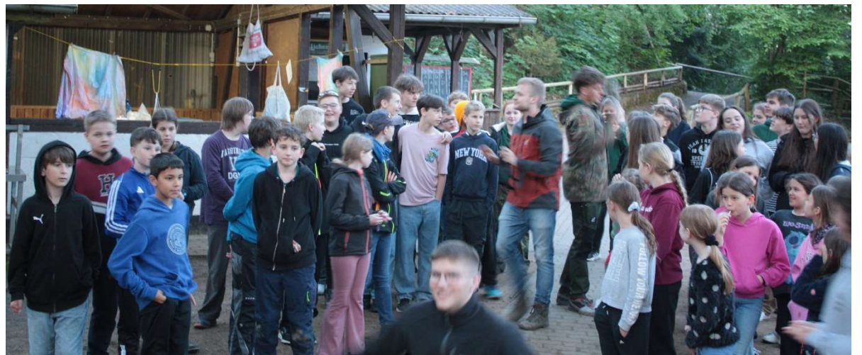
Schnappschuss der Reisegruppe vor Flugstart

Eine Gruppe mutiger, abenteuerlustiger, flinker, optimistischer und geschickter Expeditoren machte sich am Sonntag den 19.05.2024 auf in den Norden zur Expedition in die Arktis. Die lange Reise traten sie mit dem Flugzeug gegen 15 Uhr am Nachmittag des selbigen Tages an. Doch aus bisher unerklärten Gründen stürzte das Flugzeug schon am Abend vor der Ankunft über dem Wetterer Forst ab. Gutachter untersuchen aufgrund einer Ungereimtheit derzeit die Absturzursache.