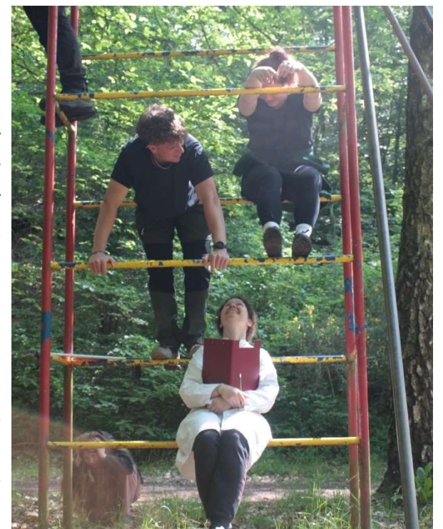
Beratende Gespräche der Bestimmungswissenschaftler

Nach dem Frühstück (und für die besonders Motivierten: nach einer Einheit Frühsport), wurden alle Teilnehmer durch verschiedene Prüfungen, wie einem Geschicklichkeitstest, einer Belastungsprobe des Optimismus, einer Wissensabfrage, einer Mutprobe und einer Abnahme der Geschwindigkeit, ihren Bestimmungen für die restliche Woche zugeordnet. Ebenfalls hilfreich für die Zuordnungen waren die Fragebögen, die zur Bewerbung für die Arktis-Expedition ausgefüllt wurden. Bei einer feierlichen Zeremonie am Lagerfeuer wurden anschließend die T-Shirts mit den entsprechenden Bestimmungslogos an jeden Teilnehmer verliehen und die Gruppen konnten sich zusammenfinden für die Gestaltung am Nachmittag.