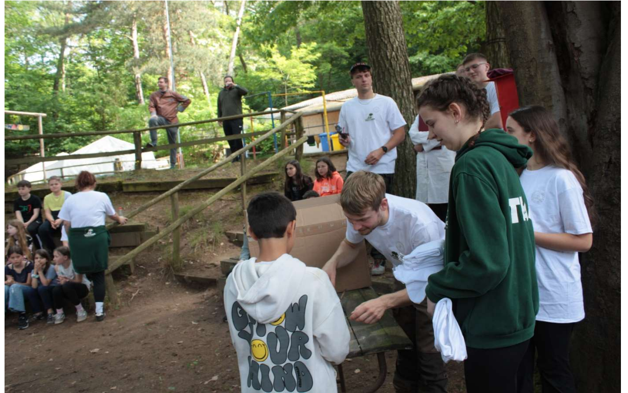
Bestimmungszeremonie: Verkündung der Ergebnisse und Ausgabe der T-Shirts