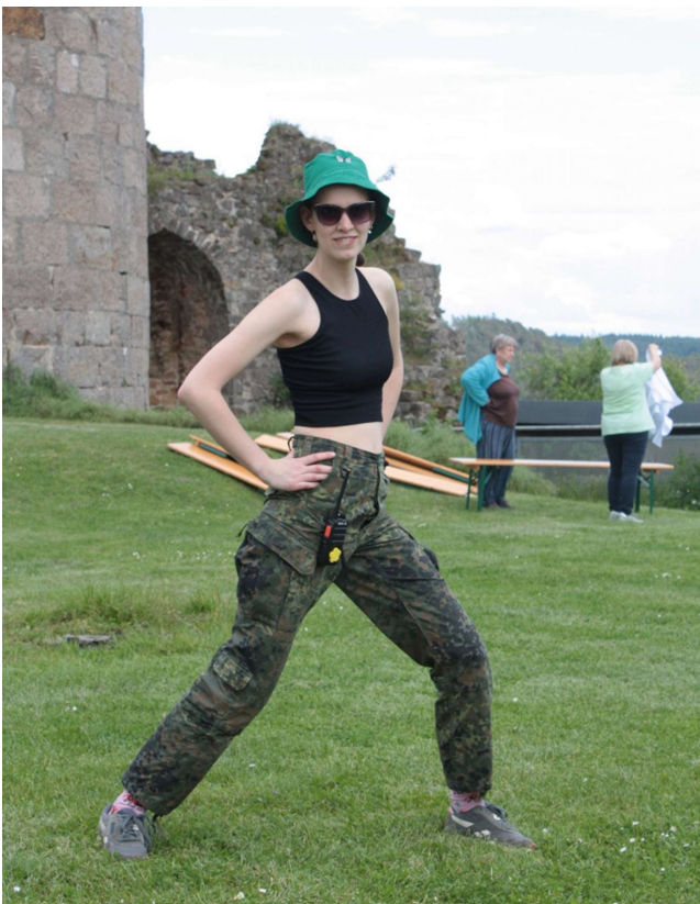
Ist sie der Spion?

Am Donnerstagvormittag wurden die Bestimmungen zwischen den Gruppen in verschiedenen Stationen auf die Probe gestellt. Der geschickteste musste einem Fragenhagel die Stirn bieten, der flinkste sollte blind, durch die Gruppe geführt, einen Parcours durchstehen. Außerdem musste noch Essen geangelt, Feuer gemacht, Monster verjagt, Lieder mit Wasser im Mund interpretiert werden und ein Schatz aus einem Lavasee geborgen werden.